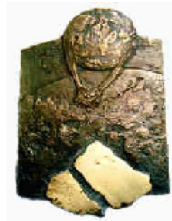
PLAKETTE verbleibt in der Schule