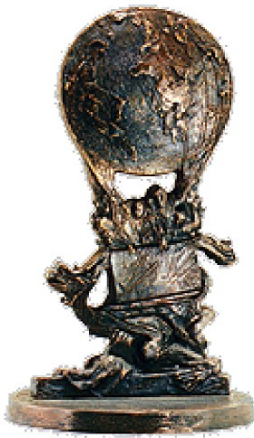
STATUETTE „Die Schöne Gaia“ (Vorderseite)